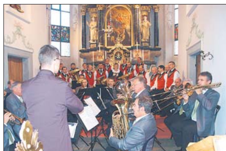
Heimatliche Klänge in der Pfarrkirche Risch.